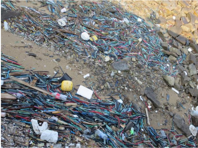
Drifting oyster pipe